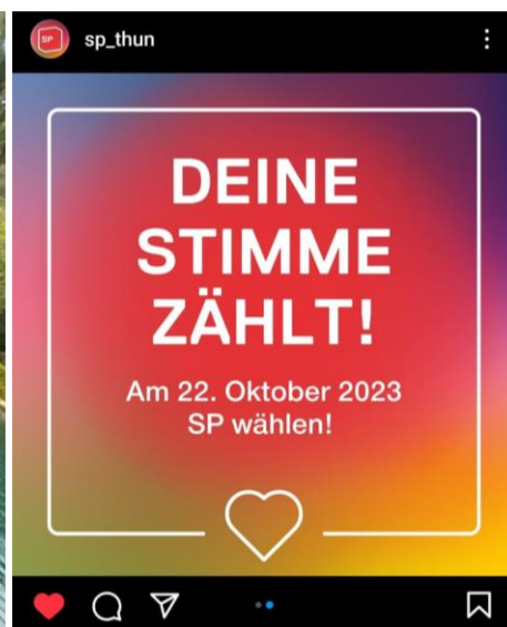
Ausschnitt aus der online-Kampagne.