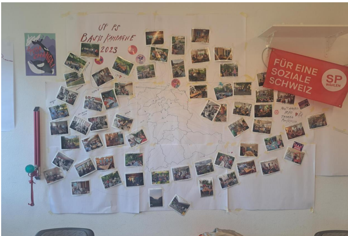
Übersicht über alle Polit-Apéro im Kanton Bern. Hängt im Sekretariat der SP Kanton Bern.