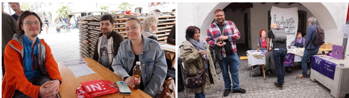
Neues und altes SP-Präsidium beim 1. Mai.