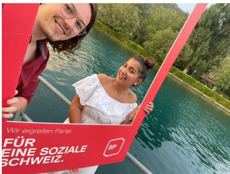
Fototermin in der Pause.