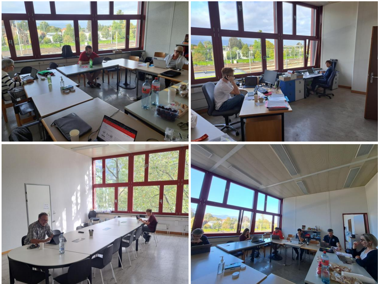
Impressionen aus grösseren Telefonaktionen in Thun.