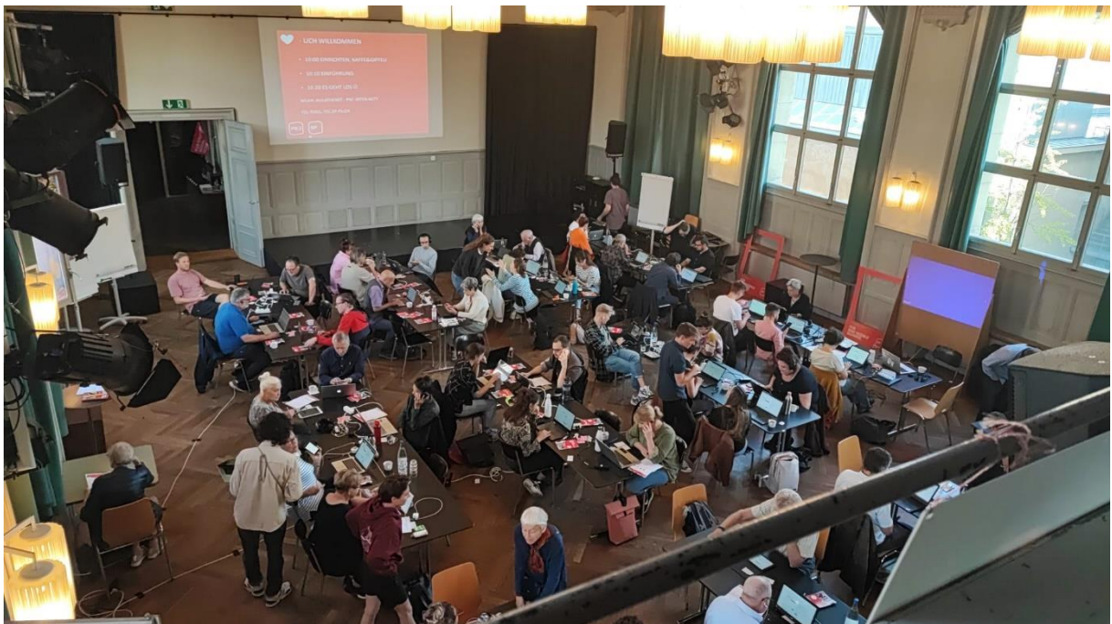
Grösste Telefonaktion im progr in Bern.