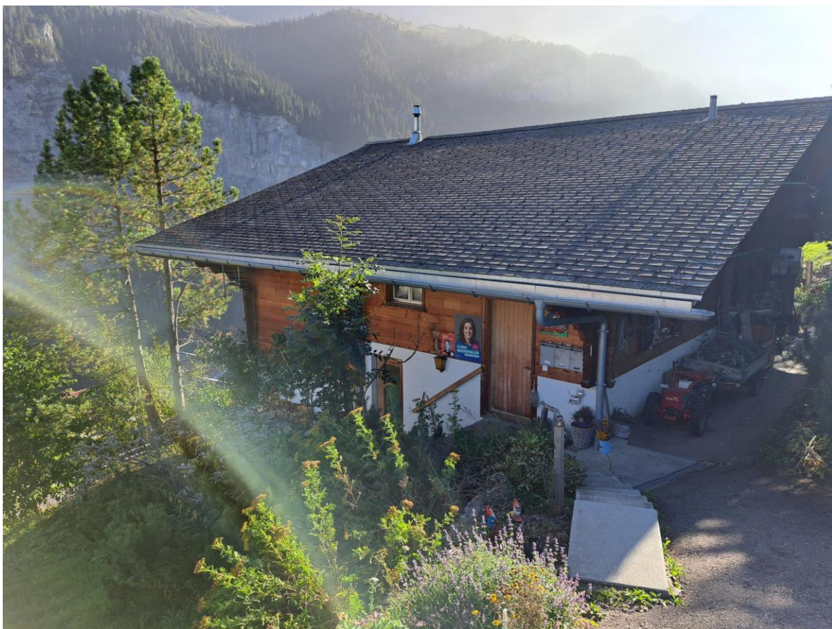
Aufsteller auf einer Wanderung im Berner Oberland.