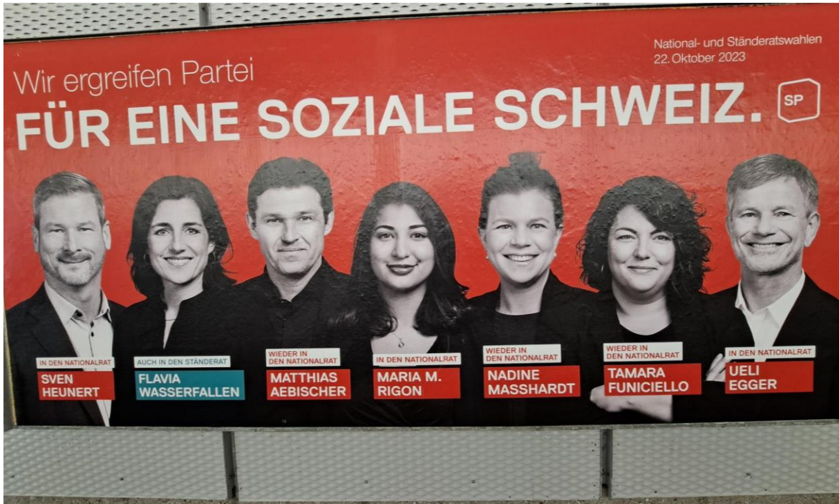
Plakat am Bahnhof Thun.