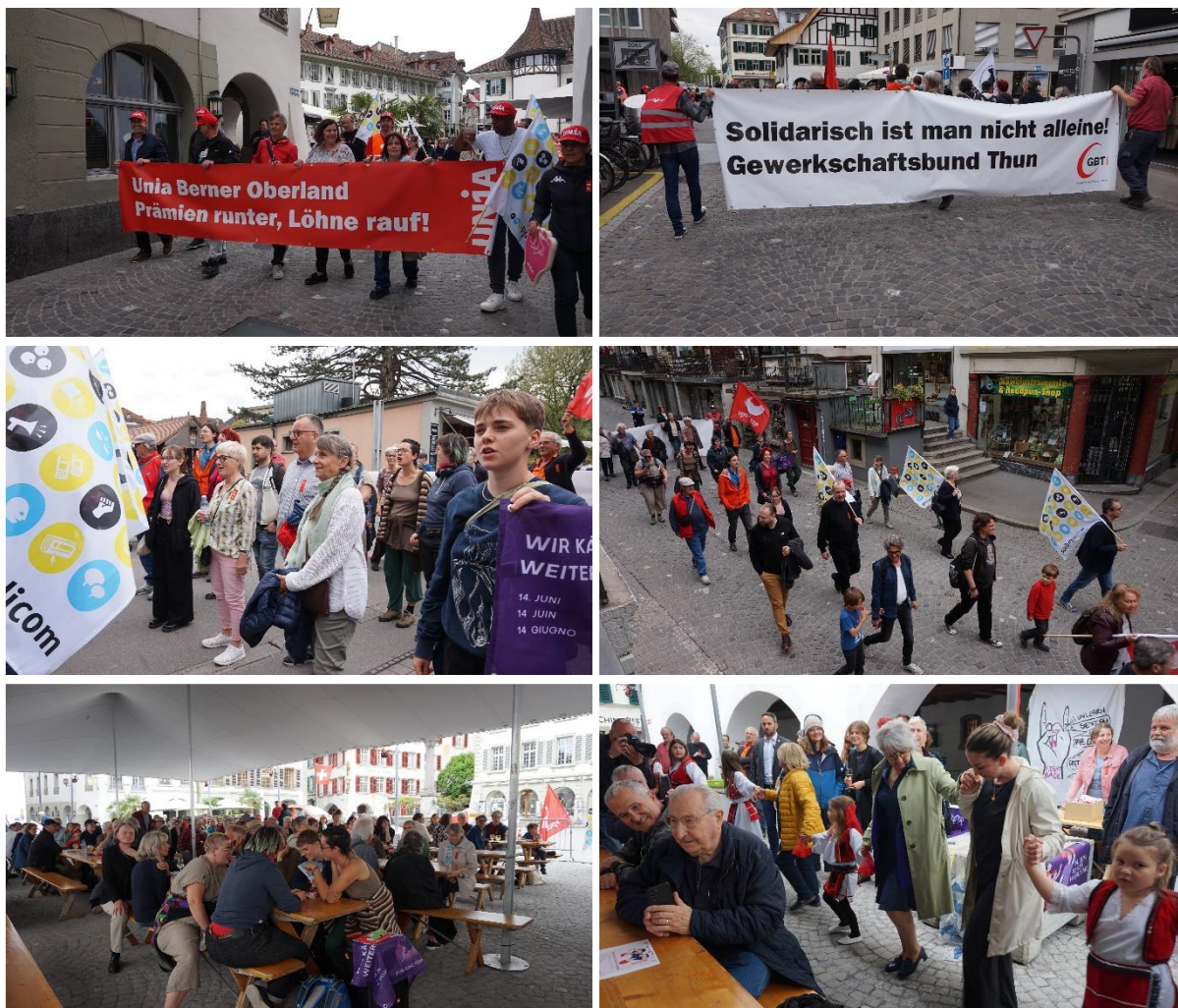
Impressionen vom Umzug und vom Rathausplatz. Letztes Bild: Bundesrätin Elisabeth beim Tanzen.